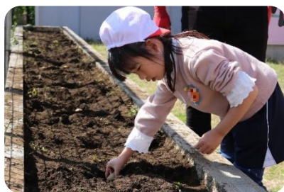
(種いもをそっと穴へ…)