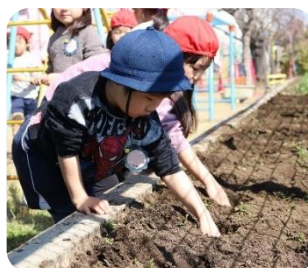
(畑の土と良く混ぜ合わせて)