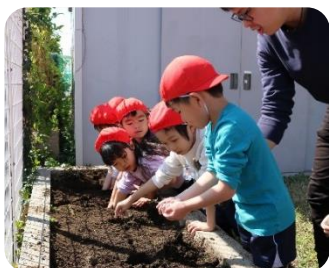
(栄養たっぷりの土をまき)